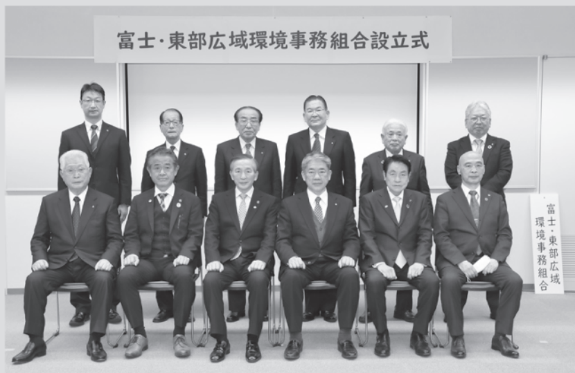
▲ 堀内管理者（前列中央）並びに11名の副管理者

※ごみ処理を共同処理する12市町村の長（4市2町6村）： （後列左から）丹波山村、富士河口湖町、忍野村、山中湖村、鳴沢村、小菅村 （前列左から）道志村、大月市、富士吉田市、西桂町、都留市、上野原市