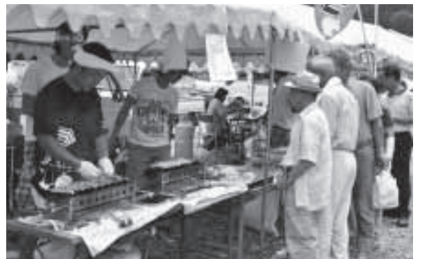
▲へい いらっしゃい!