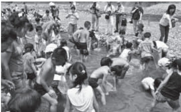
▲ニジマス捕まえることができたかな?