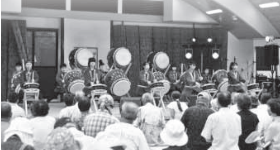
▲奥多摩清流太鼓によるオープニング