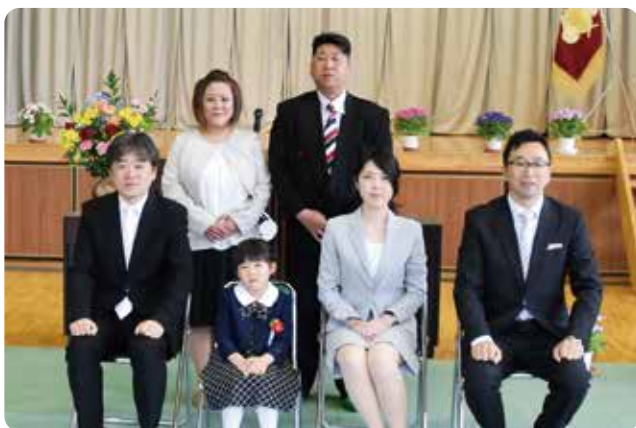
▶ お父さん、お母さん、先生方と一緒に