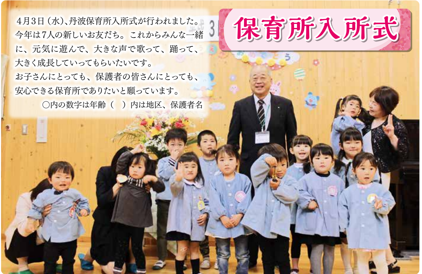
▲ 村長さんと一緒に、元気いっぱいです！