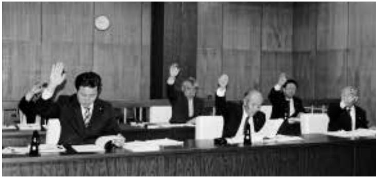
▲挙手による採択の結果可決されました(3月議会)

審議された案件は、令和元年度一般会計補正予算と監査委員選任の2件の議案が提出され、すべて原案のとおり可決されました。