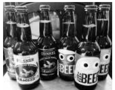
▲ 村のオリジナル焼酎、日本酒、ビール

鹿児島県の酒造会社に古式甕仕込みにより、ビールは清里の萌木の村に醸造を依頼する予定であります。さらに、昨年12月に開催された子ども議会でも提案されたオリジナルサイダーの製造販売も予定しております。いずれも丹波山産の原料を使用したオリジナル商品であり、将来にわたり定着させたいと考えております。