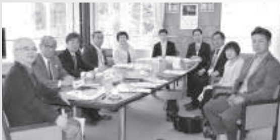
▲ 5月10日、第1回策定委員会を開催しました。

村の現況は、さらなる少子高齢化の進行が予想される中、丹波山村が目指す子どもたちの姿を実現し、より良い学校教育を発展させ、その結果が地域全体に良い影響をもたらすという観点から、新しい学校づくりに向けた環境整備について具体的に検討を進め、すべての村民が生涯学び続け、いきいきと暮らしていける“人が輝く丹波山の教育”を柱にしながら、将来的に推進していく「教育ビジョン」の策定を進めています。