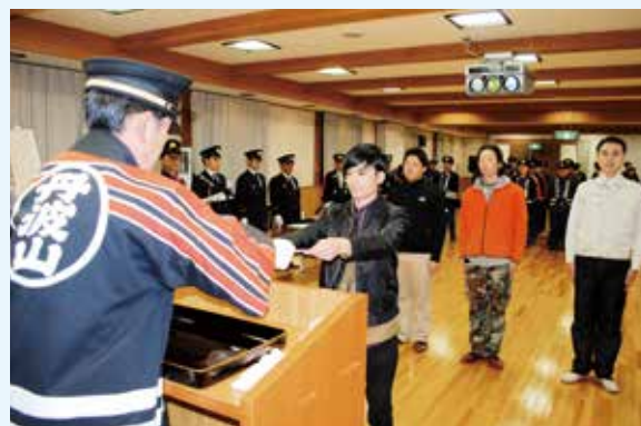
▲ 新入団員へ辞令が交付されました