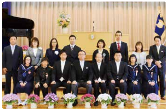
▲ ご両親、先生方と一緒に