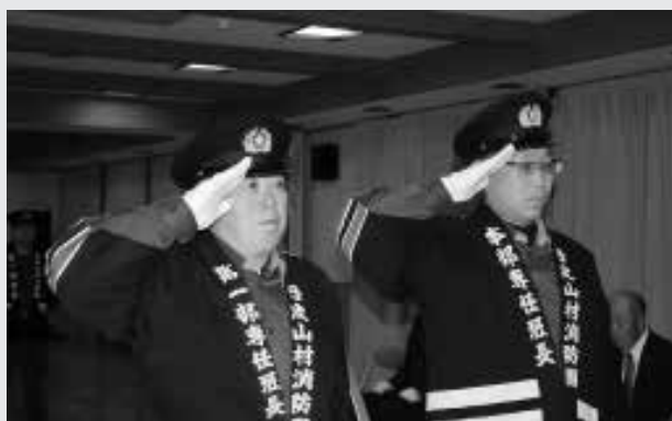
▲長い間、お疲れ様でした