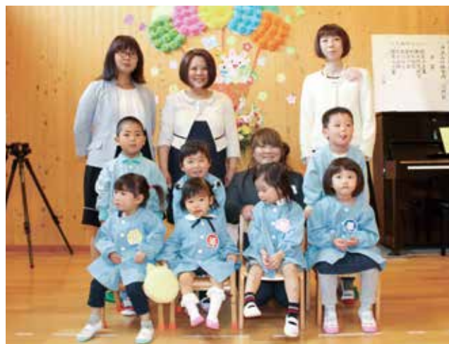
▲ お母さんやお友だちと一緒に