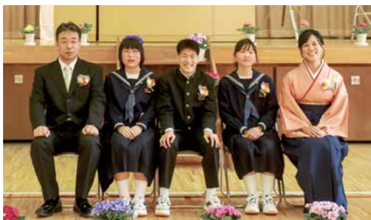
▲ お世話になった先生方と一緒に