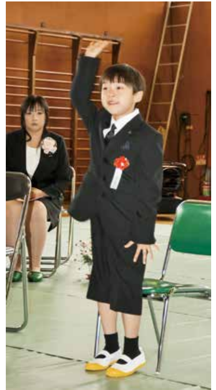
▲ 元気いっぱいのお返事です