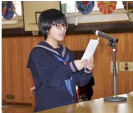
▲ 新入生代表 誓いの言葉