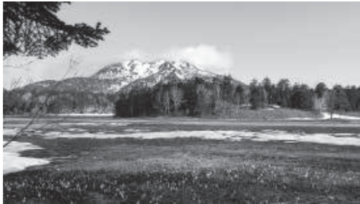
▲ 美しい尾瀬を抱える檜枝岐村です。