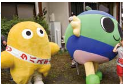
▲ 狛江市のキャラクター えこまさんと2ショット