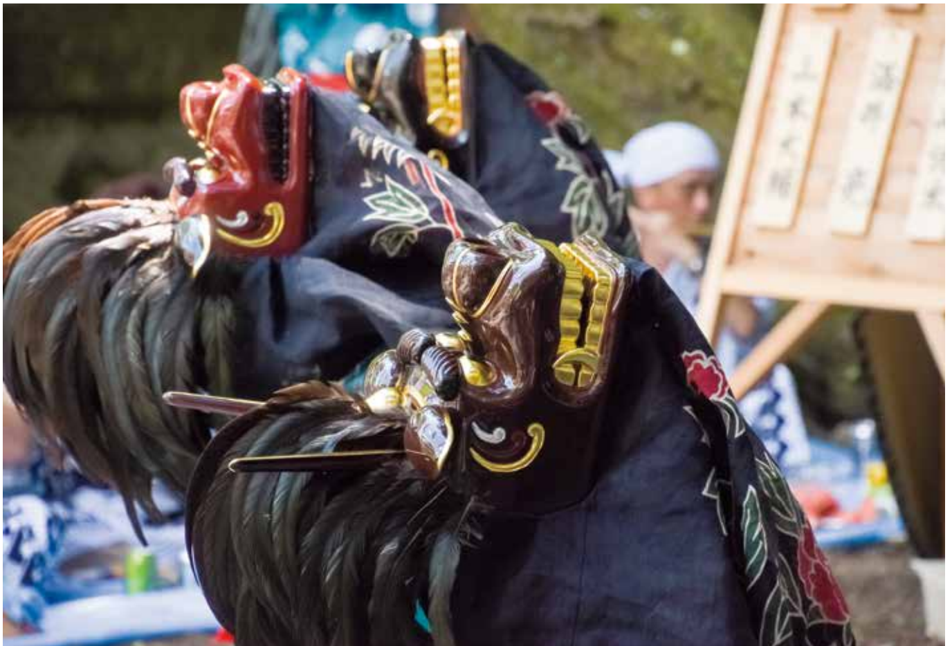
鮮やかに輝く三頭獅子

編集と発行 丹波山村教育委員会 ■山梨県北都留郡丹波山村890 TEL ■0428-88-0211 FAX ■0428-88-0207 E-mail ■info@vill.tabayama.yamanashi.jp URL ■http://www.vill.tabayama.yamanashi.jp/