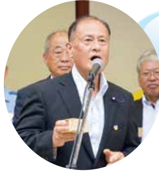
▲ 白木議長による乾杯のご発声