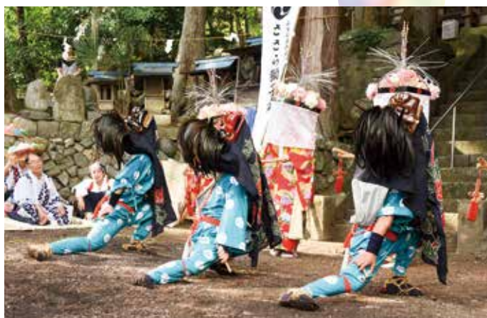
▲ 息がびったり合っています

7月15日(土)、16日(日)2日間村内の各神社でさらさ獅子舞が奉納されました。 今年は、山梨放送によるテレビ取材や多くの観光客の方々により会場が埋め尽くされ、新調した美しい獅子頭の披露も行われ、例年以上に盛り上がりしました。 非常に蒸し暑い気候の中、文化財保存会、小中学生の皆さんによる華麗な舞が披露されました。 今後も丹波山村の伝統文化の継承とともに、多くの方々目の触れられるような伝統行事であってほしいと思います。