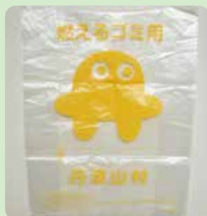
▲ 旧ゴミ袋も継続して使えます