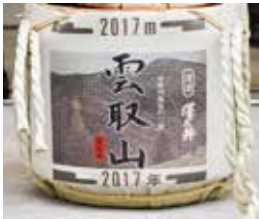
▲ 今年は2017年雲取山仕様です。