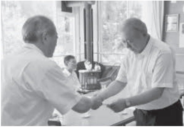
▲ 村長室にて任命式を行いました