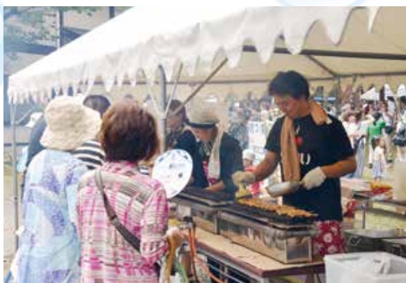
▲ フードゾーン也大盛り上がり