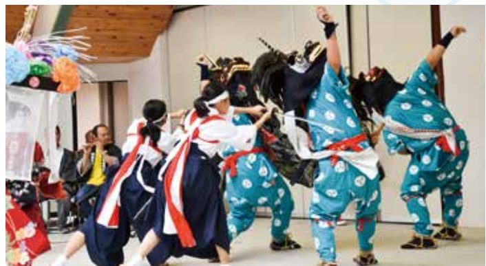
◀ 子ども獅子舞の披露