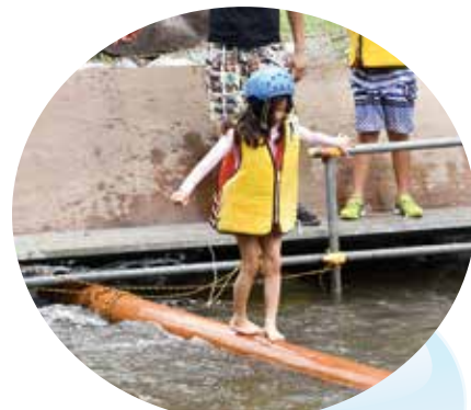
▲ ドキドキの丸太渡り