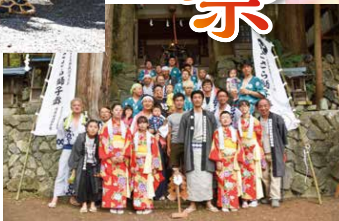
▲ 今年はさらさを中学生が担当してくれました。