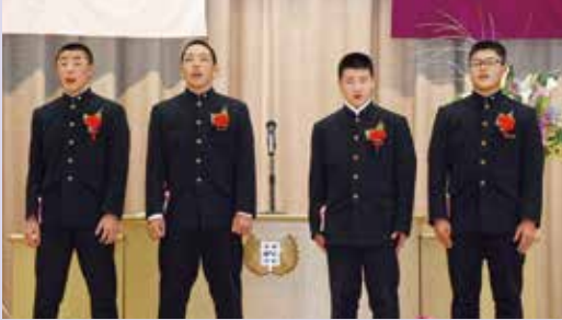
▲ 力強く希望にあふれた合唱でした