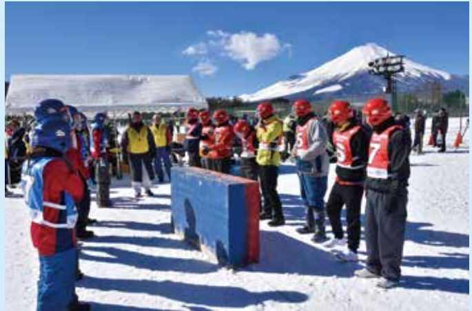
▲ 富士山の下、正々堂々勝負しました！

当日は、富士山が見える抜群のロケーションの中で、チームは勇敢な戦いを果たしましたが、惜しくも準々決勝にて敗退となりました。