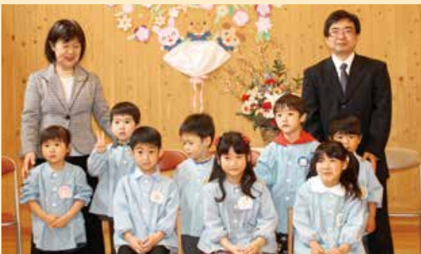
▲ 大好きな先生・お友達と一緒に