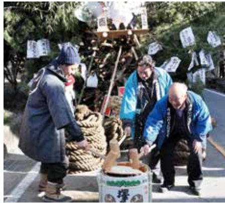
▲今年も元気に鏡開き！