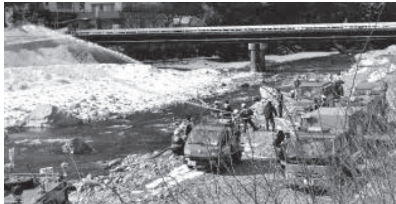
▲ 今年も見事な一斉放水でした！

平成29年1月15日(日)、丹波中学校体育館において平成29年丹波山村消防団出初式が挙行されました。消火班、通信班ともに日頃からの訓練の成果を十分に発揮し、多くの村民の皆様にご覧いただきました。今年も消防団にたくさんのご芳志をいただきました。ありがとうございます。