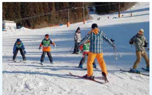
▲ 先生のアドバイスを真剣に聞いています。