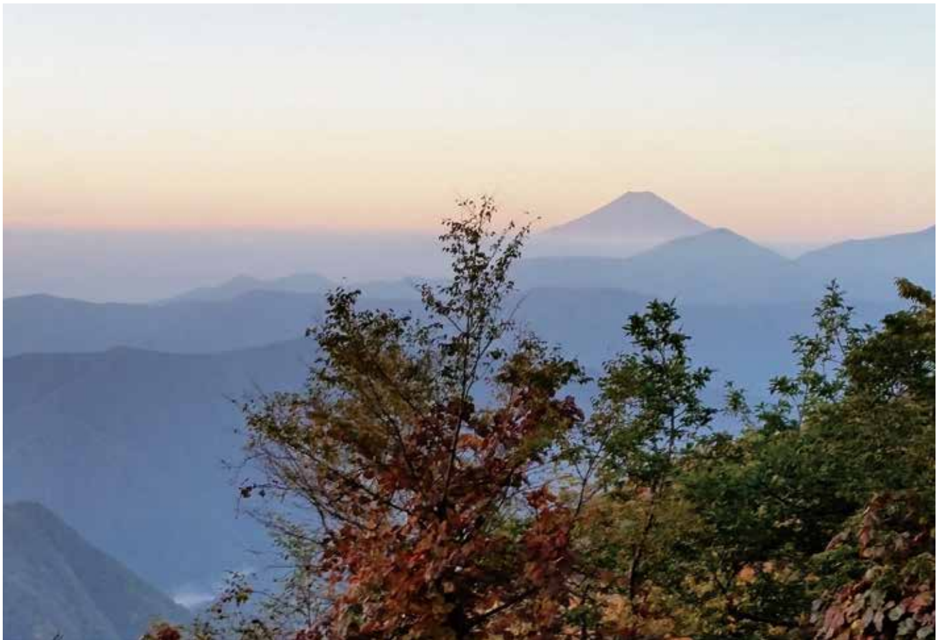
七ツ石小屋から望む霊峰富士。2017年今年は雲取イヤー（雲取山標高2017m）です。

編集と発行 丹波山村教育委員会 ■山梨県北都留郡丹波山村890 TEL ■0428-88-0211 FAX ■0428-88-0207 E-mail ■info@vill.tabayama.yamanashi.jp URL ■http://www.vill.tabayama.yamanashi.jp/