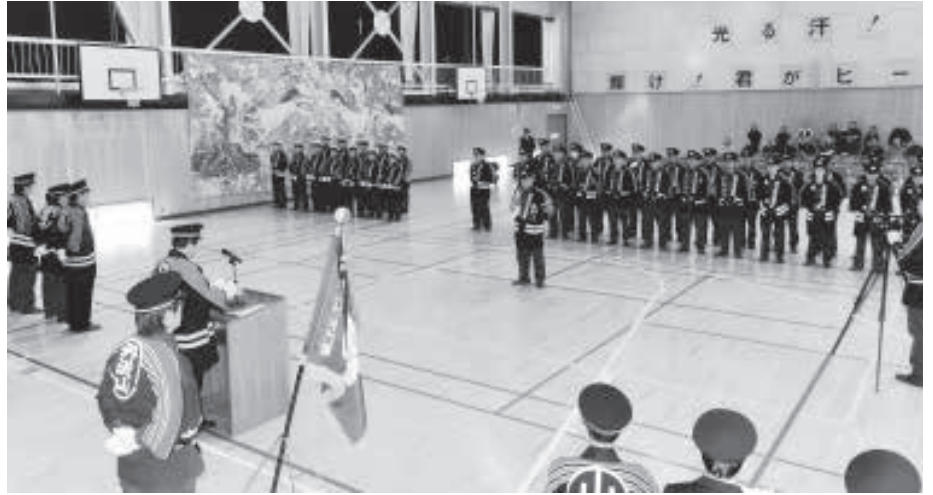
▲ 厳正な式典となりました。