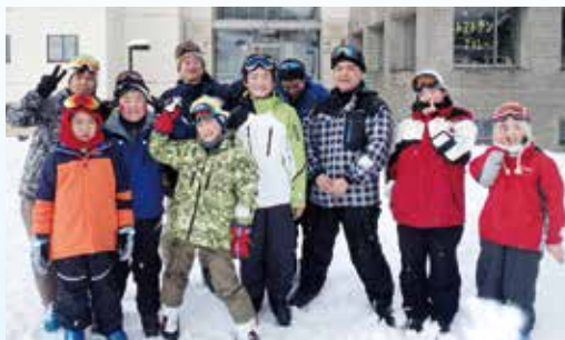
▲ みんな2日間お疲れ様でした!

スキーに慣れた中学生が小学生たちにやさしく教えてあげている様子を見て、集団生活の中で子どもたちが大きく成長していると感じました。