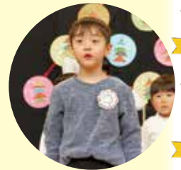
▲ 絆起くん、かっこいいぞ!