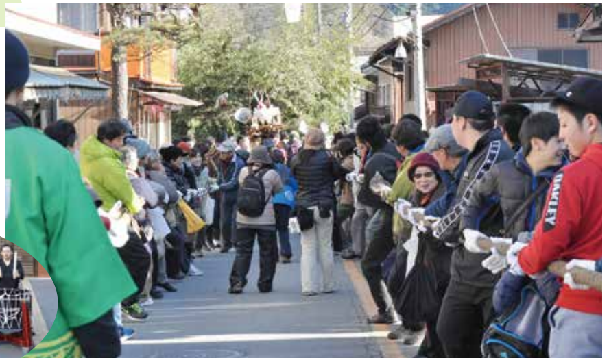
▲大勢の皆様にご参加いただきました。