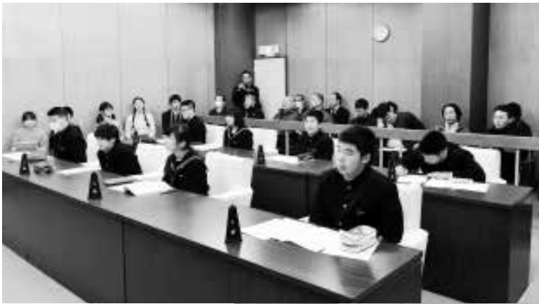
▶丹波山村について真剣に考えています。

平成28年12月13日(火)、丹波山村村議会議場において、丹波中学生が議員さんに扮し、丹波山村職員に意見や質問をおこなう「子ども議会」が開催されました。