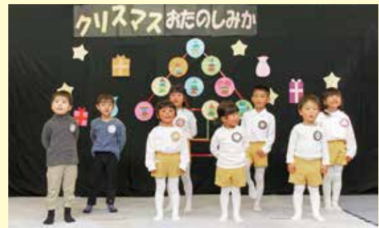
▲ みんな、お歌が上手です。大きな声が出ていますよ!