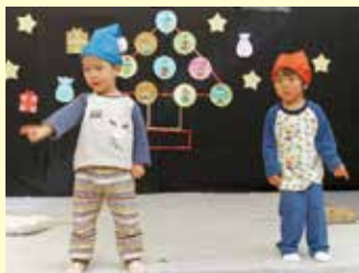
▲ どちらも、ふたりの息はぴったり