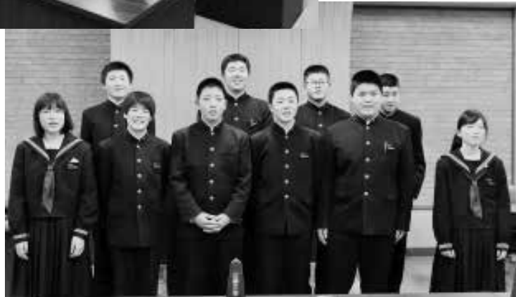
▲議会が終わりホッとしている様子でした

生徒たちは最初緊張している様子でしたが、議会が開始すると一生懸命自分たちの思いを届けるため、大きな声で質問や意見をしていました。