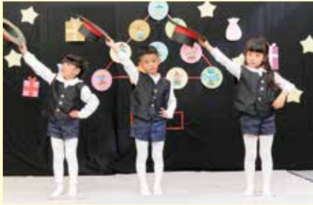
▲ 年長さん3人組、決まったぜ!

平成28年12月17日(土)丹波山村保育所において毎年恒例のクリスマスお楽しみ会が開催されました。