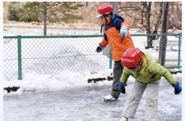
▲ おととと。転ばないぞお。