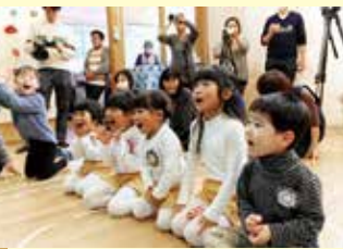
◀ サンタさんと トナカイさん登場～