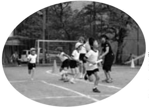
◀抜かれてたまるか!