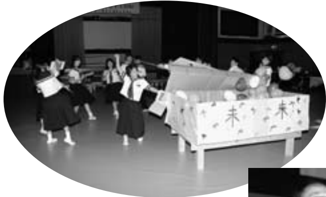
▲ 未来にはばたけ、私の夢！