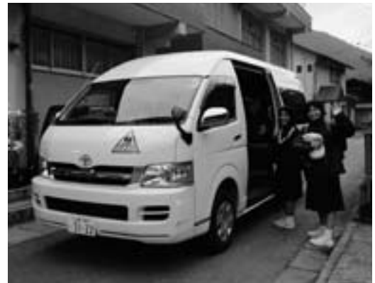
◀ 新しくなったスクールバス

審議された内容は、人事案件3件、条例改正12件、決算認定10件など24件の議案、発議では「村議会議員の定数削減」など3件が提出され、すべて原案のとおり可決されました。