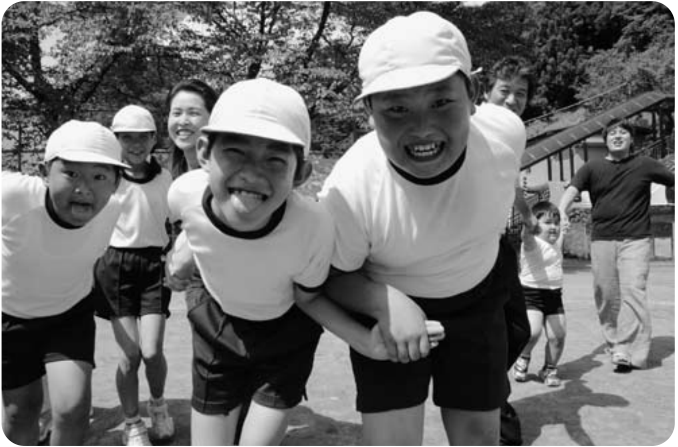
◀フオークダンスなんだけどな…