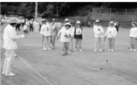
◀静子さん、さすがです