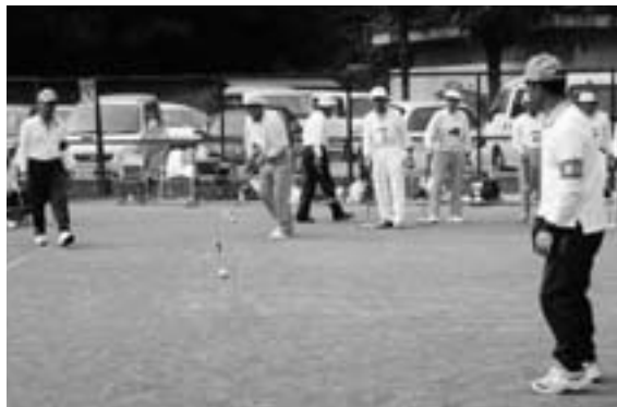
▲光明さん、ナイスショットです