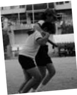
◀やさしい駒ちゃん