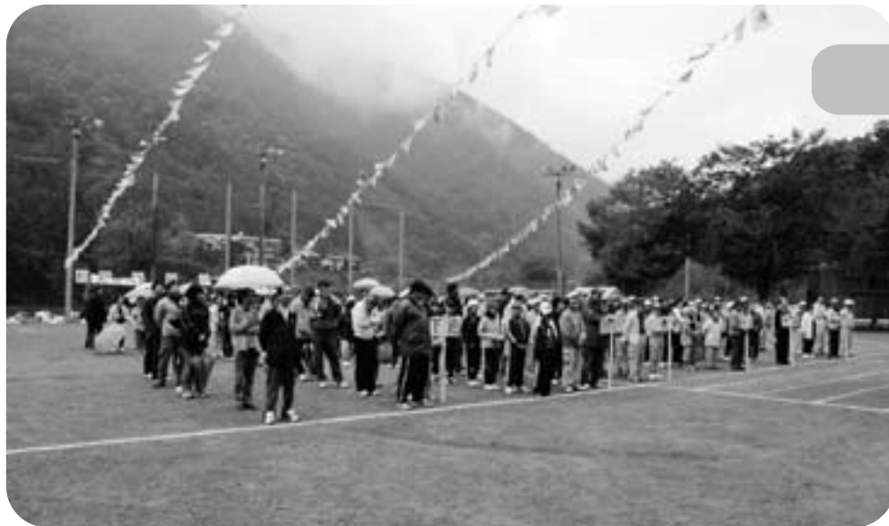
◀ 閉会式だけの村民体育祭でした？