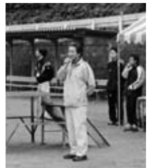
▲ うーん、中止します…