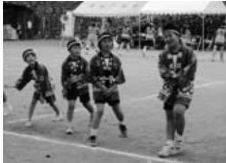
◀全校児童のソーラン節