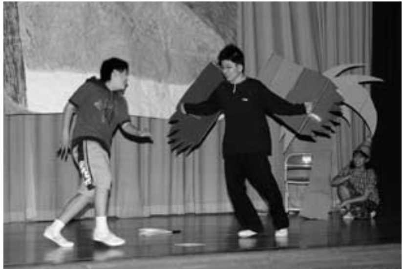
◀ 全校劇の「もう一人のピノキオ」