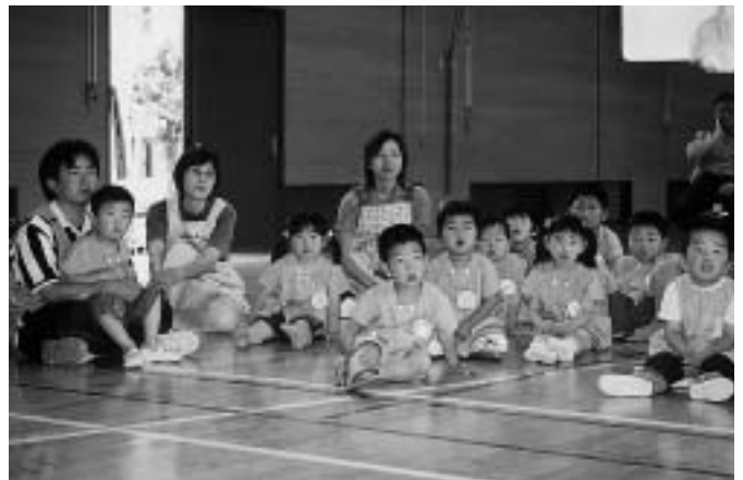
交通安全、絶対に守ります。