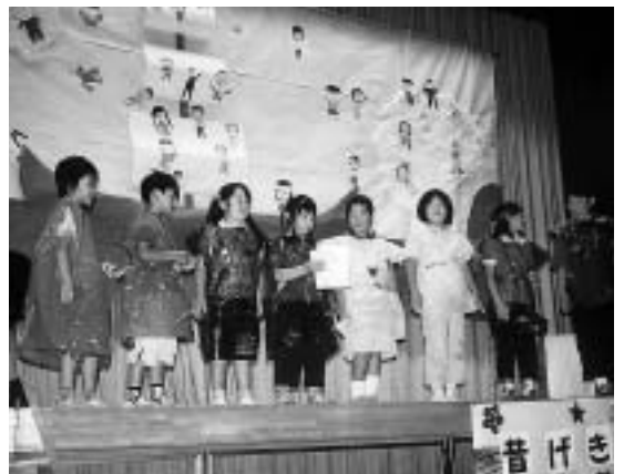
工夫を凝らした黄組