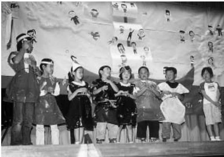
元気いっぱいの緑組