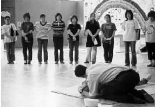
真剣に見入る保護者のみなさん

救急車が現場に到着するまでの間に患者に対し行う「心肺蘇生法」を人形を使って体験し、いざというときに役立ててもらおうことを目的と