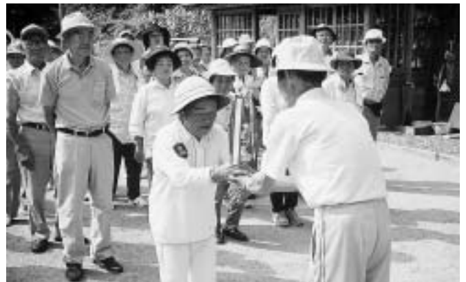
奥秋チームのみなさん、おめでとうございます。