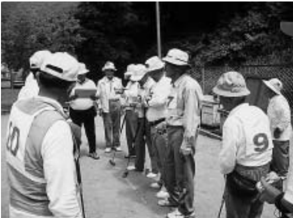
▶ 一生懸命頑張りました。

空には雲一つない青空の下、選手のみなさん・応援団のみなさん、本当にご苦労様でした。