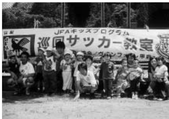
サッカー大好き！みんな元気に「ハイ・ポーズ」