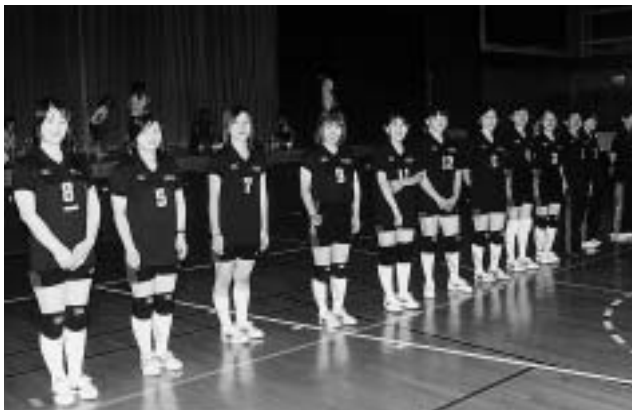
本当にお疲れさまでした。

は接戦の末残念ながら敗れましたがその悔しさをバネに一生懸命頑張って練習をしてきました。そして、今回の試合に臨みました。第