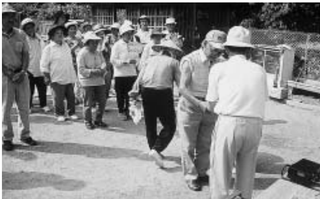
高齢者表彰「いつまでも元気にハッスル」

「ふれあいゲートボール大会」にふさわしい楽しい一日を過ごしました。みなさん、ご苦労様でした。