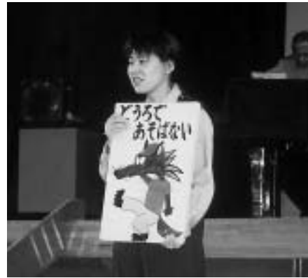
交通安全、みんなで守ろう

人形劇と腹話術により交通安全についてわかりやすく子どもたちに説明していました。交通量の多くなる季節になり、道路を歩いたり、横断したりする時には今まで以上に注意をしなければなりません。「道路で遊ばない」「道路を横断するときは右左の確認をする。」「道路に飛び出さない」など、大きな声で元気いっぱい約束してくれました。