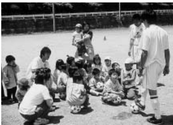
サッカー選手は、「カッコイイな〜」