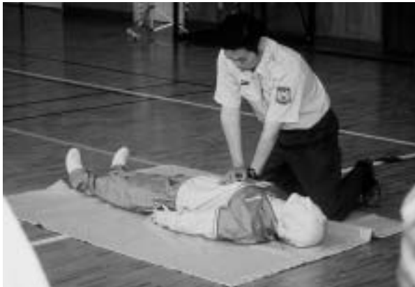
「助かってほしい」という気持ちが伝わります。

して行ったものです。参加した保護者のみなさんや先生方は、最初のうちは恥ずかしさがあったようですが、講習が進むにつれ声が大きくなり、キビキビとした動作となり、「人を助ける」という気持ちが見てわかるほど真剣に行っていました。あつてはならない水難事故ですがもしそのような場面が身近で起こった場合、誰でも「心肺蘇生法」ができることが理想であり、このような講習会がある時は一人でも多くの方に参加していただきたいと思います。