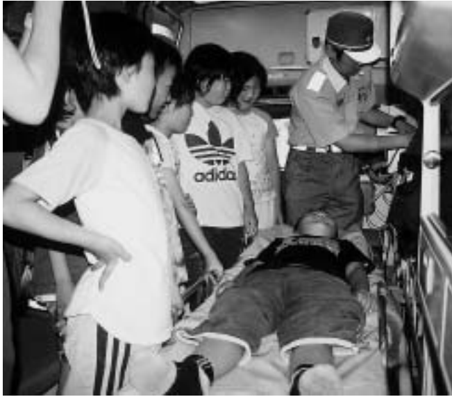
救急車の中は小さな病院だ！

6月24日(木) 丹波小学校4年生7名が丹波山村役場に社会科見学にやって来ました。今回は、役場内にある大月消防署丹波山出張所の仕事についての勉強でした。