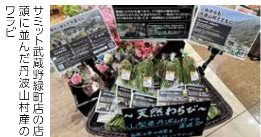
サミット武蔵野緑町店の店頭に並んだ丹波山村産のワラビ

サミット株式会社では、丹波山村と締結した「地方創生に関する包括連携協定」に基づき、昨年10月から丹波山村へのネットスーパーの配達を始め、現在は月・水・金曜の週3日、武蔵野緑町店(武蔵野市)からお届けしています。新たな試みとして、ネットスーパーの配達車の帰りの便を活用して村内で収穫したワラビを運び、4月25日から店頭での販売を始めました。今