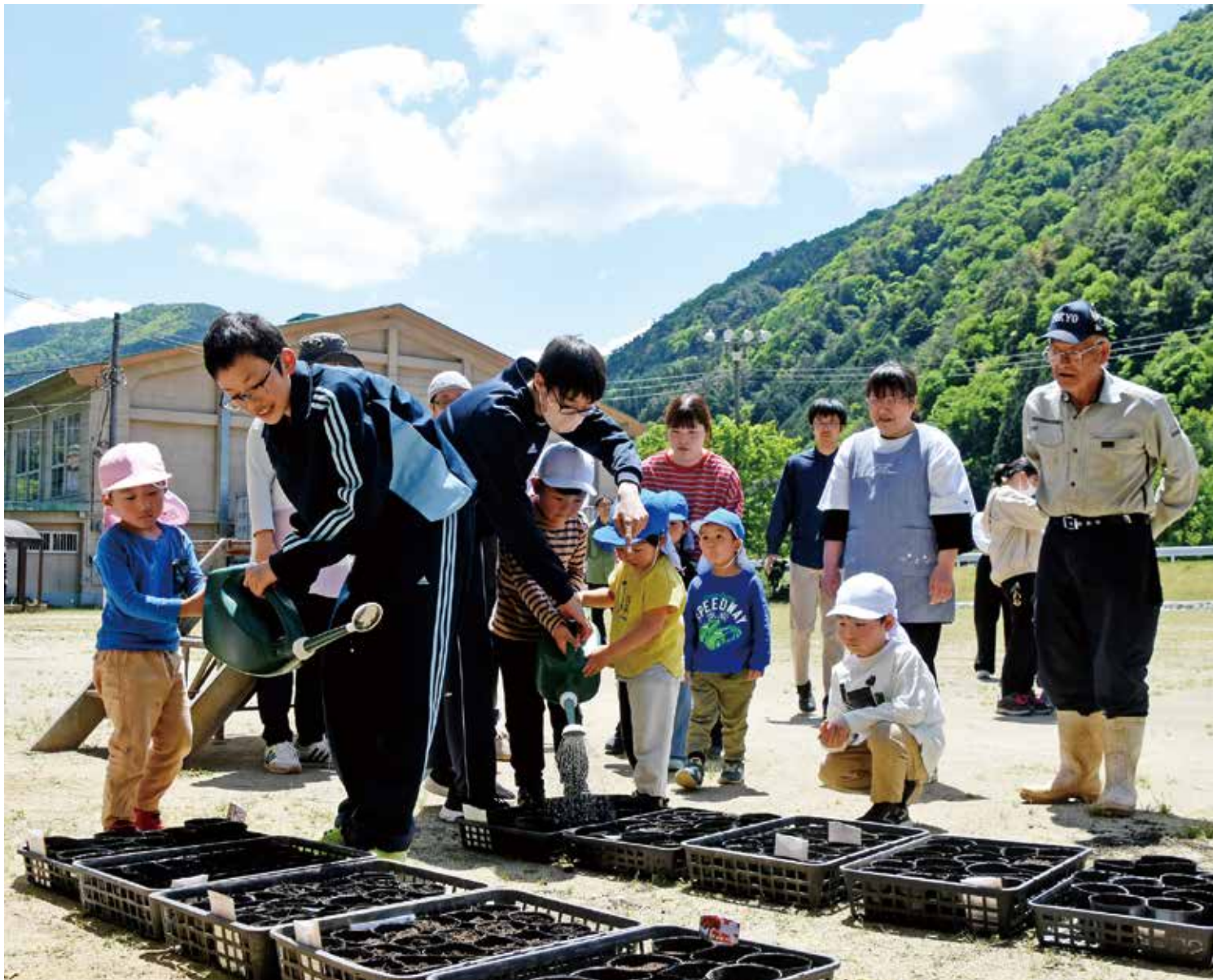
保育所、中学校、老人クラブによる花の種まき交流会が5月11日に丹波中学校校庭で開かれました。五月晴れの空の下、声を掛け合いながらマリゴールドと百日草の種をポットに植え、水やりをしました。