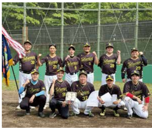
優勝旗を手に記念撮影する「飛龍」のメンバー＝4月19日、奥多摩町登計原山村広場運動公園

スギ花粉の少ない森へ 植え替えにご協力いただける 森林所有者を募集します 丹波山村では、スギ花粉の発生源であるスギの人工林の植え替えを進め、「伐って、使って、植えて、育てる」という森林資源の循環利用のサイクルを確立させながら花粉の少ない森林に転換していく「花粉発生源対策事業」を実施します。本事業は、行政と森林・林業関係者等が一体となつて取り組むもので、次の3条件を全て満たす森林の所有者を募集します。詳細は、振興課へお問い合わせください。 ① スギを主体とした林齢50年生以上の人工林 ② 木材の搬出が可能な森林 ③ 直近10年間で造林補助金の交付を受けていない森林