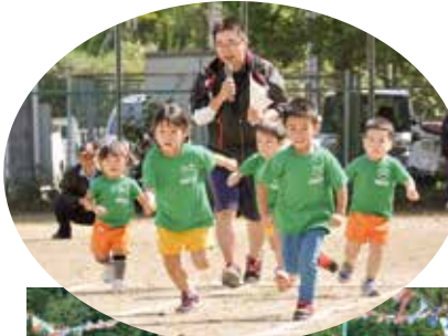
▼ かけっこ競走、「よ～いドン！」