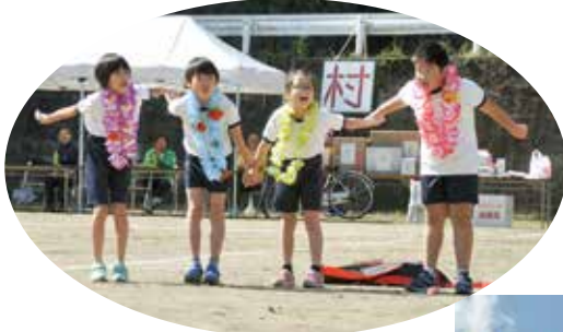
▲ 小学生のかわいい演技に注目～！