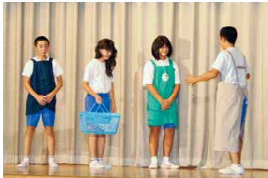
▲ 2学年発表「働くこと=生きること」