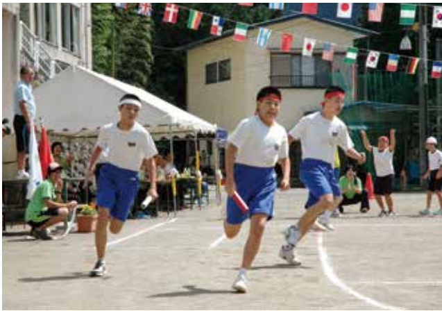
▲ さあ、優勝目指してバトンリレー

残暑の厳しい日でしたが、協力・努力・全力のスローガンのもと、優勝を目指し、暑さにも負けず、全力で戦う逞しい児童・生徒たちの姿や表情に皆、熱視線を注ぎました。