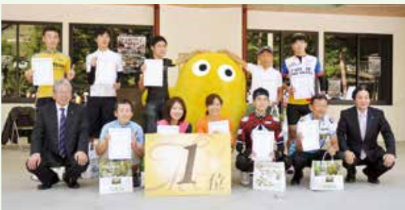
▲ タバスキーと各部門1位の皆さんです

本年は丹波山村をメイン会場に大会が行われ、選手たちは、急坂・激坂に息を切らしながら、合計2回のタイムトライアルに挑んでいました。