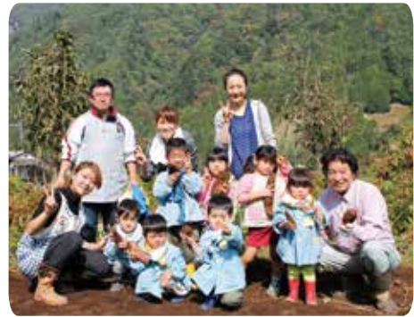
▲ おいもと一緒にピース！

10月22日（木）、成畑地区の畑で保育所児による、さつまいも掘りを行いました。保育所のみんなはと言うと、、、大きくとても美味しそうな、さつまいもを全員探ることができたようです。