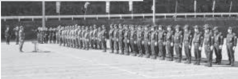
▲ 整列する両村の消防団員