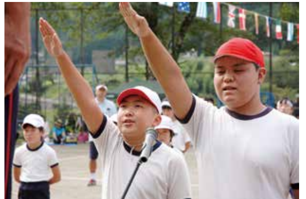
▲ 気合いの入った選手宣誓