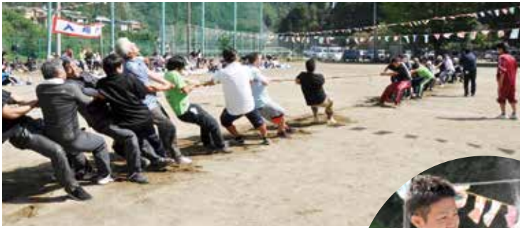
▲ 一進一退の大接戦！