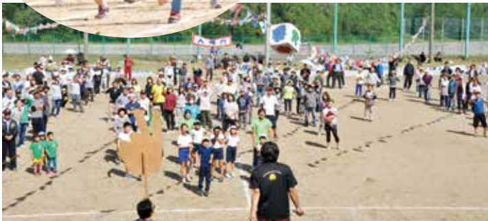
▲ 最後は、今年も恒例！じゃんけん大会