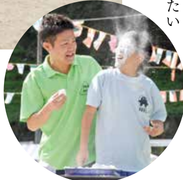
▲ もしや2人は名コンビ？