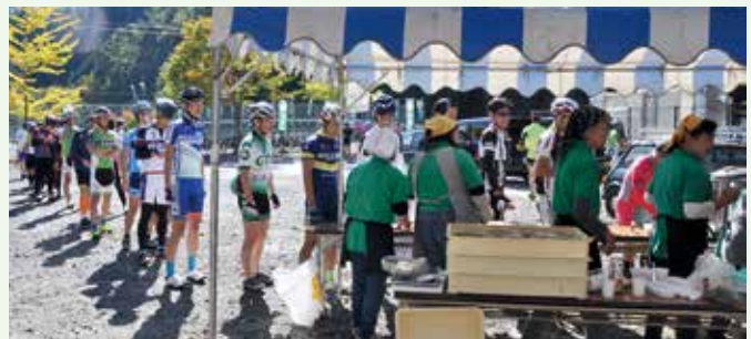
▲ 村からおもてなしに、長蛇の列