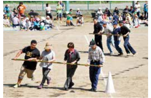
▲ 意外と目が回ります！