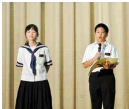
▲ 1学年発表「とびら開けて～鍵と迷惑大王」