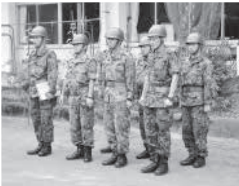
▲ 自衛隊の皆さんにもお手伝いいただきました。