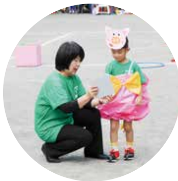
▲ ぱくぱくこぶたさん競走