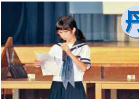
▲ 3学年発表「思い出に残る名場面」

9月12日(土)、無限∞な新たな可能性を求めてくをテーマに第47回清流祭が開催されました。全校音楽・各学年の発表・創作ダンス等が行われました。丹波中生徒の個性あふれる発表に、中学生のこれから無限に広がる未来や、新しい力を、来場した多くのお客さんも感じることができたのではないかと思います。