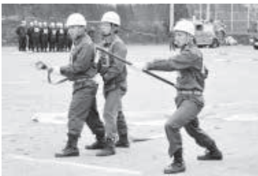
▲ 消防操法を披露する選手たち

本年も、小菅村と合同で実施され小型ポンプ操法などを披露し、日頃の訓練の成果を発揮しました。また教官の鋭い指導もあり、気合を注入できた一日でした。