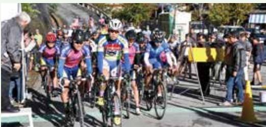
▲ さあ、スタートです。

10月18日（日）、丹波山村と小菅村の今川峠を舞台に、第3回多摩川源流ヒルクライムTT in 丹波山・小菅が開催されました。