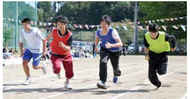
▲ 今年のリレー優勝はどのチーム？