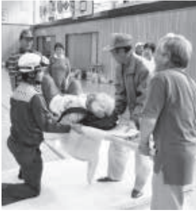
▲ 簡易担架作成の様子

また、自衛隊の方々にもご協力いただき、防災意識をより一層高めることができました。