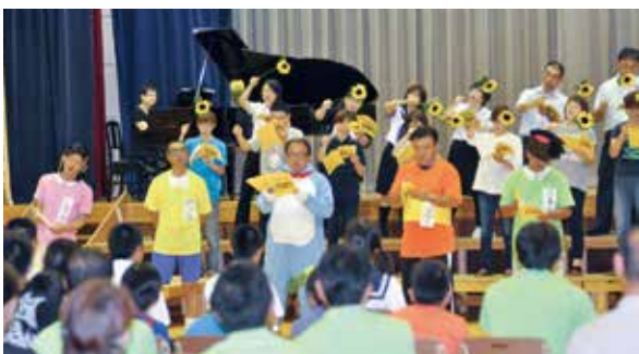
▲ 教職員の合唱、ドラえもんとならった「ひまわりの約束」