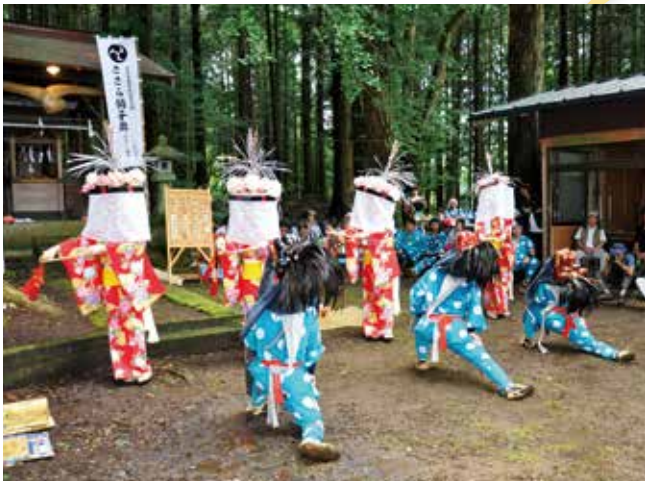
▲ 大六天神社での雌獅子隠し