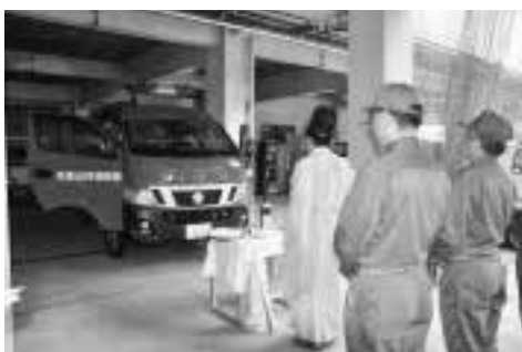
▶ 消防多機能自動車