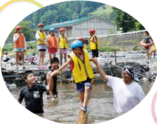
▲ 仲良く手をつないで渡ろう・・・