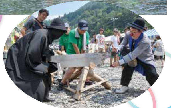
▲ 謎のコンビ、丸太切りに挑む