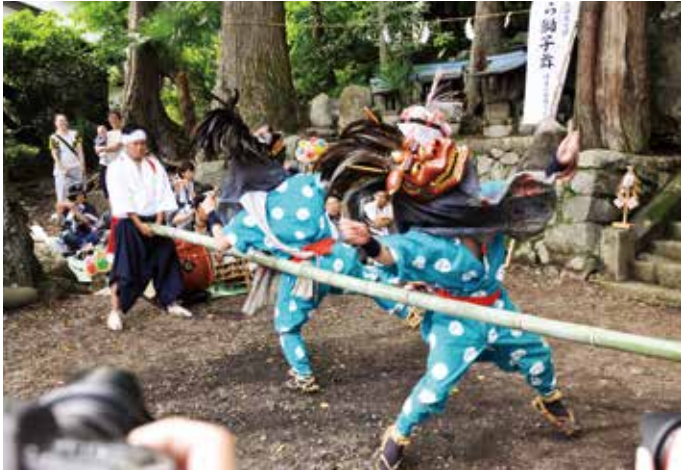
▲ 熊野神社での竿がかり

本村の「夏の風物詩」であるこの伝統行事が、今年も盛大に披露され、快晴の空の下、勇ましい獅子舞の姿と、美しいささらの姿に、多くの村民やギャラリーが魅了されました。暑さを吹き飛ばす本村の熱い文化「伝承の舞」を見ることができました。