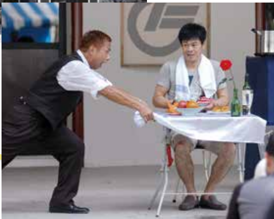
▲ 度肝を抜かれた大道芸パフォーマンス