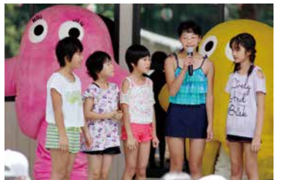
▲ 丹波小女子もステージに登場！