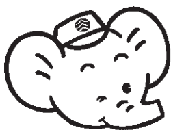
ほくは安全エレちゃん