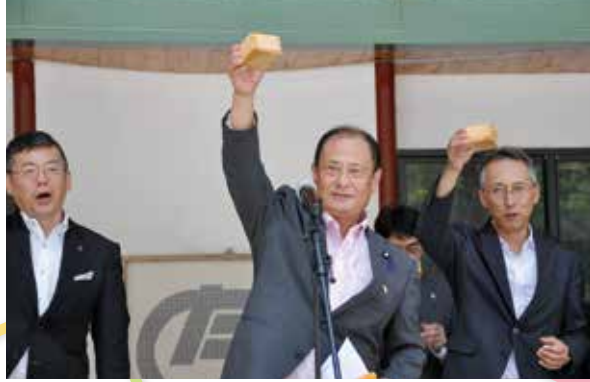
▲ 白木議長による乾杯の発声