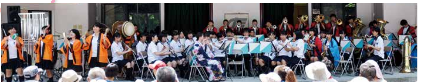
▲ 思いのまま音を表現した立川高校吹奏楽部