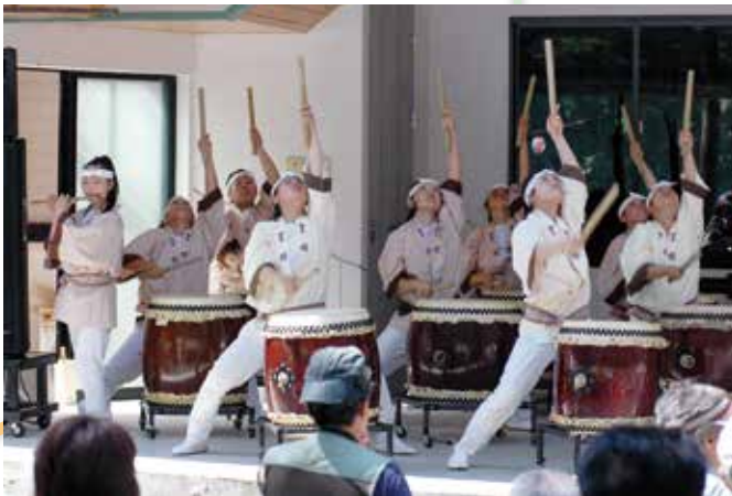
▲ ど迫力の笛吹高校すいれき太鼓部