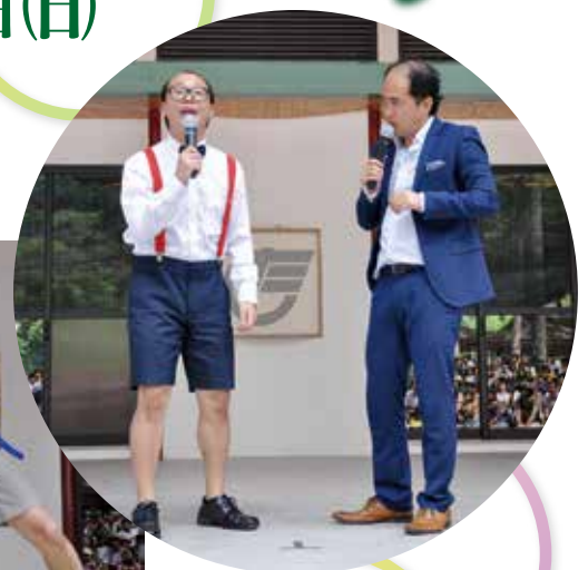
▲ 大爆笑だった吉本お笑いライブ