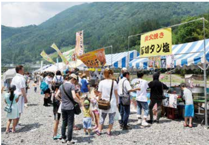
▲ フードゾーンも盛り上がっていました