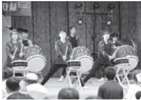
▲オープニングは奥多摩清流太鼓