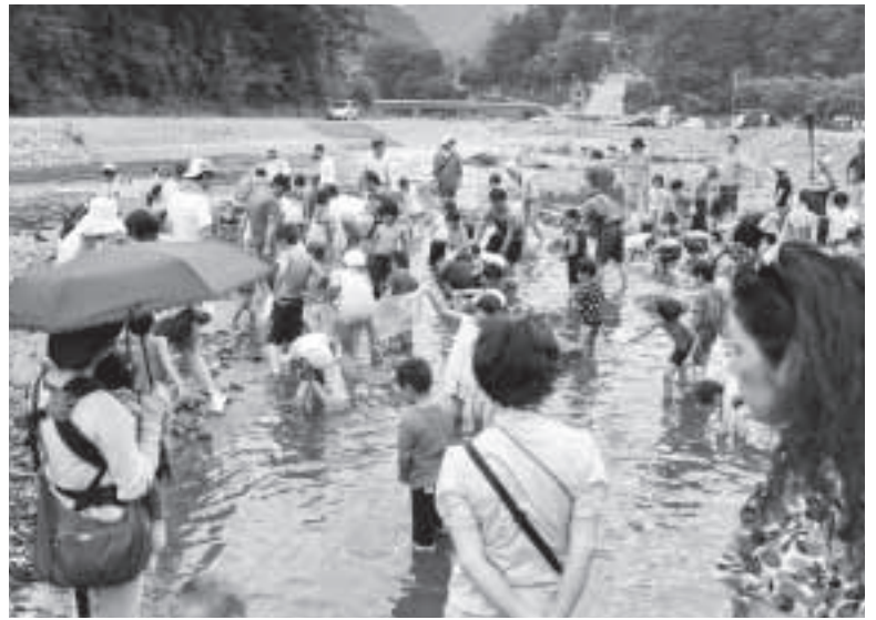
▲魚のつかみ取りです