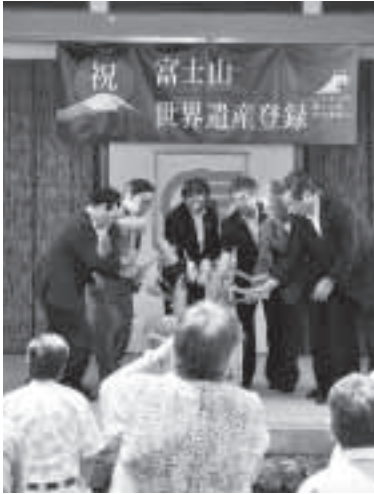
▲来賓の方による鏡開き

また、カヌー教室や丸太渡りなどのイベントが多数あり、子どもたちにとっても大変記念になる一日でした。