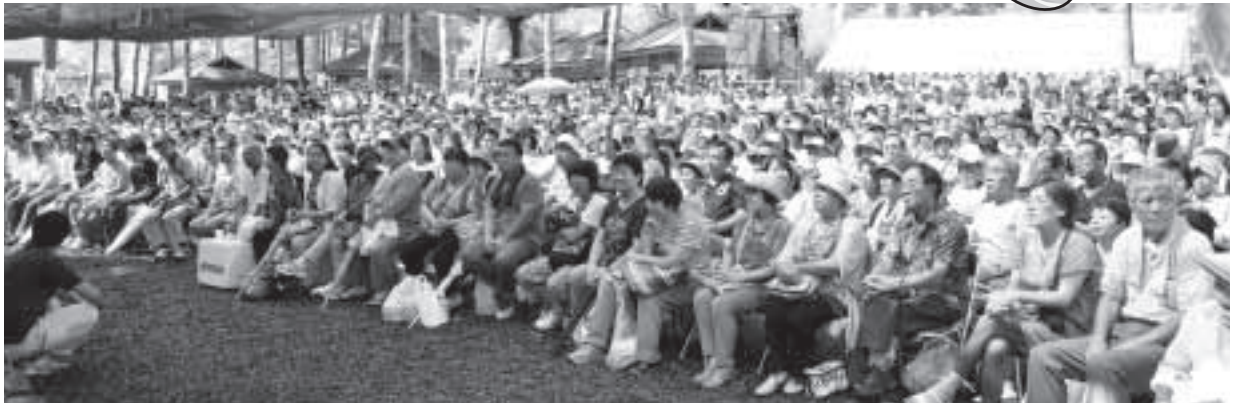
▲メイン会場は多くのお客様で賑わっています