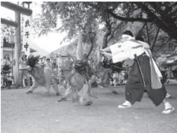
▲小学生による白刃

7月13日(土)、14日(日)の2日間村内各神社で獅子舞の奉納が行われました。快晴の中、この日のために練習を積み重ねてきた文化財保存会、小学生・中学生の皆さんの勇姿が披露されました。今後も丹波山の伝統文化を継承し、大勢のお客様を魅了する丹波の伝統行事であってほしいと思います。