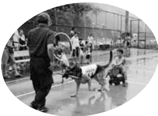
警察犬もがんばりました