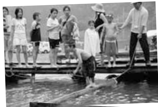
水上丸太渡りはバランスが勝負