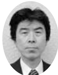
嶋崎義人 議員 厚生経済常任副委員長