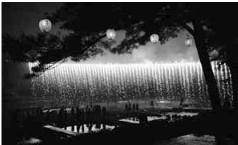
丹波川にかかるナイアガラで グランドフィナーレ