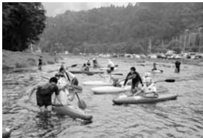
カヌー教室で川とふれあう