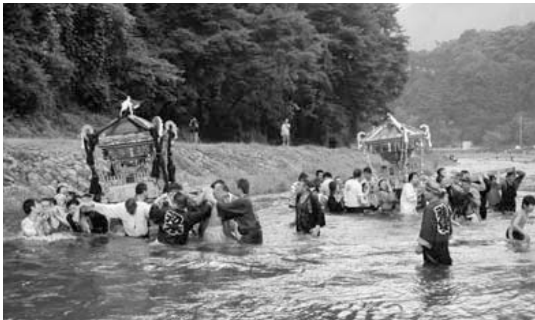
豪快！川を渡る神輿

あいにくの雨模様の中でしたが、多くのお客様を迎え恒例の「夏まつり丹波」が盛大に開催されました。この夏まつり丹波も今回で20回の節目を迎えることができました。これもひとえにこの祭りを支えてくださった皆様のおかげといえるでしょう。