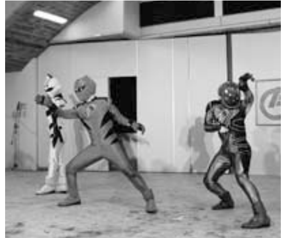
たぎれ 獣のカービースト・オン! ゲキレンジャー変身!