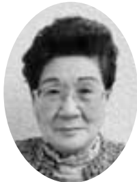
木下香奈子 議員 総務教育常任委員