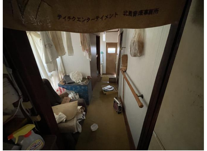
1階廊下 (居間～浴室・洗面台・トイレ)